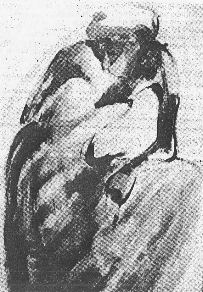
EVELINE SWIDDE "Saudade"